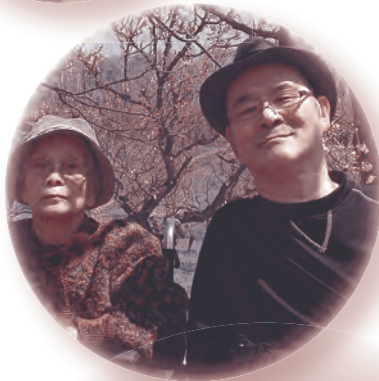
▶満開の梅の木の下で

・イオン札幌平岡では…… イオンで買い物をしたあとは平岡梅林公園へ寄り道して、散歩など楽しみました。梅林公園では、ちょうど白と赤の綺麗な梅の花が見ごろを向かえておりました。