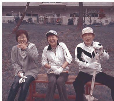
ひと休みに丁度良いベンチです♪

ご要望をいただくようになりま した。ベンチのある風景が、住 民の方に馴染みのあるものとな るよう、これからも活動を継続 していきます。