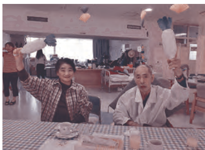
だいこんマンボでウー！