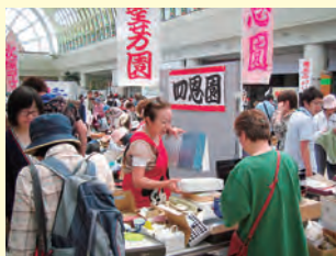
お安くしますよー

毎年恒例の「友愛バザー」。六月九日土曜日、北広島駅のエルフィンパーク交流広場で開催され、私たち四恩園も出店させていただきました。社会福祉協議会が中心となり、様々なボランティアさんの力もお借りしながら行なわれたバザーには何百人という数の来場者がありました。私たち四恩園が地域に出て友愛バザーに出店させていただくことで、たくさんの方との様々なつながりを実感することができました。ただ販売するだけではなく、お客様と共にふれあい、楽しく語り合えることができる友愛バザーとして来年もまた参加したいと思えます。来店してくださった皆様、この場をお借りして御礼申し上げます。ありがとうございました。