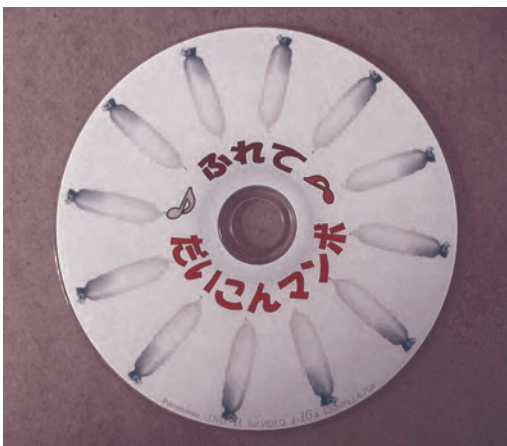
DVD「ふれて だいこんマンボ」