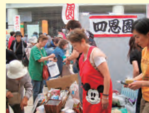
何か良い物あるかな？