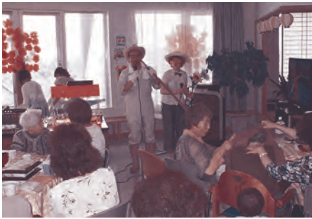
スペシャルゲスト??