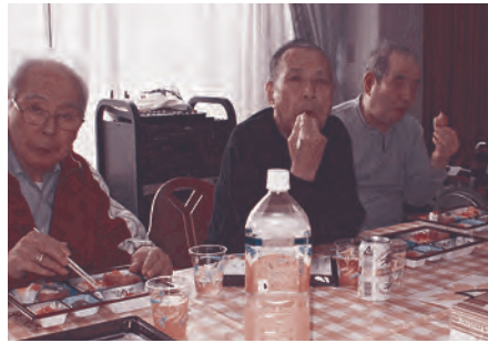
特製弁当は美味しいですか？

五月二十六日。毎年恒例のお花見昼食会が開催されました。今年は『公園の桜の下で楽しく宴会』というのをイメージし、装飾にも力を入れ、日頃のお客様の素敵な表情を撮影した写真を食堂内や廊下に掲示しました。そして、施設自慢のお料理