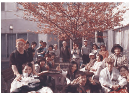
あたたかな日、桜の下で