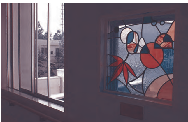
南町廊下には「もみじ」

二階、特養部は回廊式になっており、どちらから進んでも食堂に辿り着くようになっています。その特性を活かし、廊下に『四季』を通じて、日本の習慣や生活するものにとつての大切な感覚を感じて頂ける工夫を加えたそうです。お客様の居室がある廊下の壁には、十三枚のステンドグラスと四季の歌が埋め込まれています。