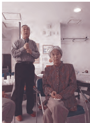
奥様へ感謝の言葉

今回で、三回目になるお花見でした。毎年風が冷たく窓越しの桜でしたが、初めて中庭に出て桜の下で写真を撮る事ができました。八重桜やしだれ桜は毎年みなさんと会えるのを、待っています。また来年きれいな花を咲かせてくれますように。