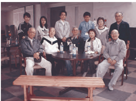
私たち「団地団らんネット」がベンチを設置しています

この活動 も三年目を 迎え、「今 年はいつベ ンチを置く んだい？」 「あそこ も置いてほ しいな」と