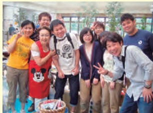
来店ありがとうございました！