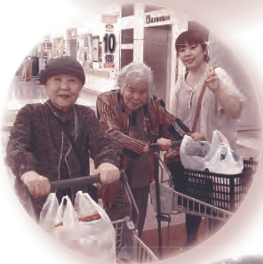
◀いっぱい買ったよ！

・新千歳空港では…… 新しくできたフードコートでの飛行機の見学では、「なんで、あんなに大きくて、重いものが飛ぶんだろうね」「飛行機に乗るのはいまだに怖いわ〜」など、それぞれの思い思いで見学しました。その後は、ロイズのチョコレート工場を見学し、食事やお土産を買っなどして楽しみました。