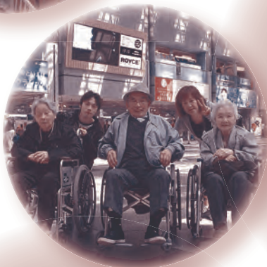
▶新千歳空港で集合写真

・新千歳空港では…… 新しくできたフードコートでの飛行機の見学では、「なんで、あんなに大きくて、重いものが飛ぶんだろうね」「飛行機に乗るのはいまだに怖いわ〜」など、それぞれの思い思いで見学しました。その後は、ロイズのチョコレート工場を見学し、食事やお土産を買っなどして楽しみました。