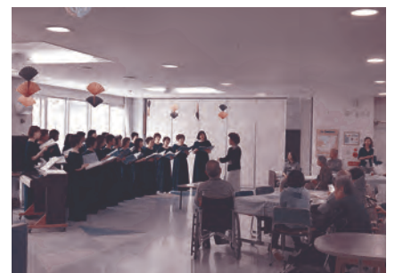
恵庭女声コーラスの歌声