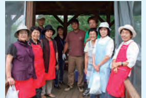
ボランティア交流会

平成8年から四恩園でボランティア活動に励んでいただいた、きらら会さんが今年の3月をもって全ての活動を終了されました。四恩園で行う行事には必ずといっていいほど、きらら会さんの姿がありました。他にも洗面台磨き、車椅子清掃、シーツ交換等とその活動は多岐に亘り、まさに縁の下の力持ちの活躍をしていただきました。活動終了はととても残念ではありますが、きらら会さんのご活躍は、今後もボランティア活動のお手本としていきたいと思えます。長い間で尽力いただき本当にありがとうございました。