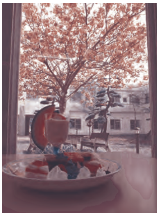
桜と今日のデザート

第二部では、「ふれて だいこんマンボ」の曲に合わせて身体を動かしてリフレッシュもできました。会食では、四恩園シェフ特製デザートも堪能、初物メロンはとても美味しかったです。参加されたご主人からは「介護は愛です」、奥様に向けて「いつも感謝しています」と普段は言えない思いを家族に伝えていた様子に心が温かくなりました。